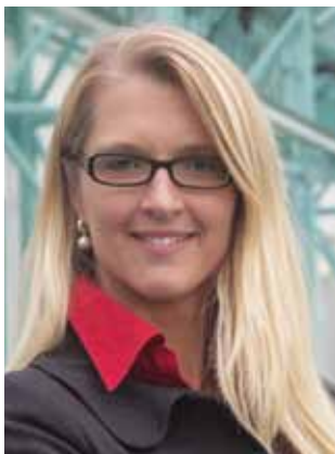
Gros: Branche muss die Bedenken der Reisebüros ausräumen

Die meisten Anbieter gehen mit verkleinerten Japan-Programmen ins nächste Jahr. Für eine Renaissance des Geschäfts muss das Vertrauen von Vertrieb und Kunden wachsen.