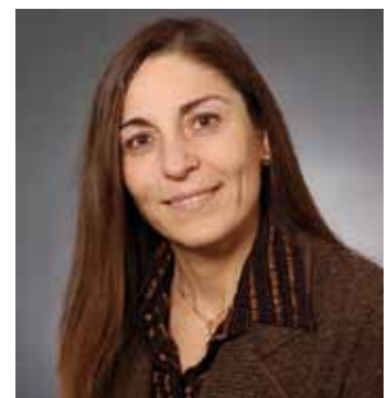
Petalidou: Ab Januar ist ANA im Wettbewerb um die neueste Technik vorn

Langstreckenflug überhaupt mit dem neuen »Dreamliner« Boeing 787. Dreimal pro Woche geht es zusätzlich zu den bestehenden täglichen Verbindungen ab Frankfurt und München nach Tokio – nicht wie gewohnt zum Flughafen Narita, sondern zum näher am Stadtzentrum gelegenen Airport Haneda. Die 787 fliegt in einer Zwei-Klassen-Konfiguration mit 158 Sitzen, von denen 46 in der Business Class und 112 in der Economy Class sind. Die First Class, die in der Boeing 777 zum Einsatz kommt, fällt weg.