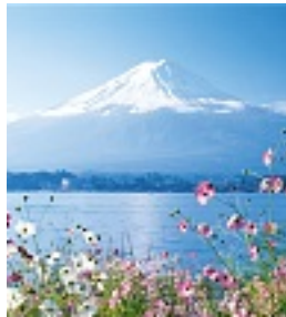
PFLICHTPROGRAMM für Touristen: Japans höchster Berg, der Vulkan Fuji.